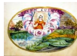
В изобразительном искусстве XVIII века