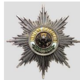
Сабж на прусском Ордене Чёрного орла