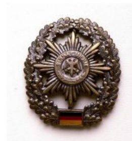
Расовые фельдъегери знают толк в своих обязанностях