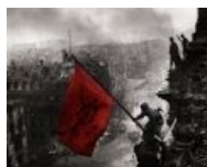
Внезапно, срыв покровов