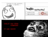
С этого все и началось