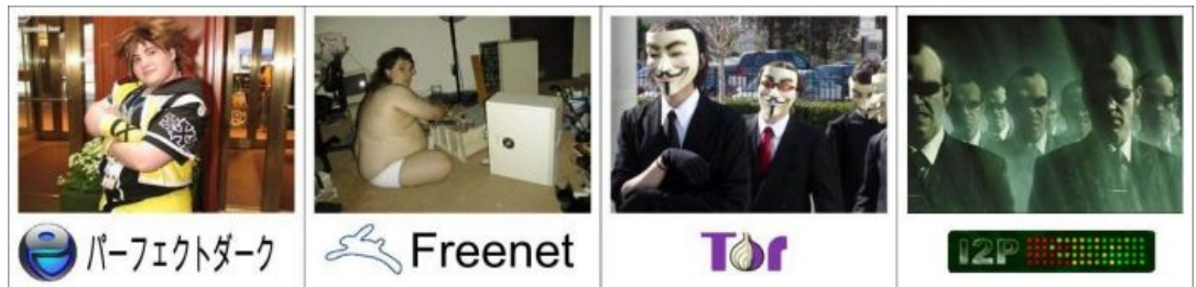
Объективное сравнение самых популярных анонимных сетей

децентрализованный распределённый аналог почты. С обычной почтой несовместим. Встраивается как плагин в I2P.