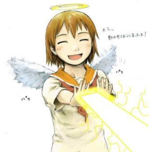
Ракка посылает всем Лучи Любви .