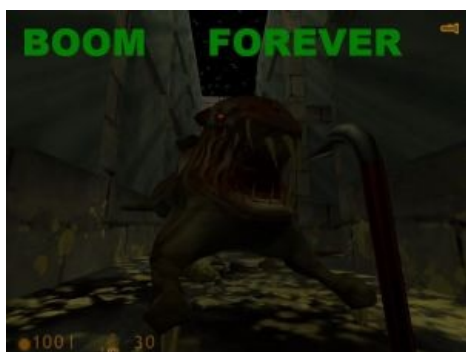
Официальная обои Boom-a

Потом с этими логами бумер побежал жаловаться на официальный форум юкоса, но его быстро выпиливают оттуда. Бумер вновь посещает хлфх.ру и ксм, но выпиливается моментально.