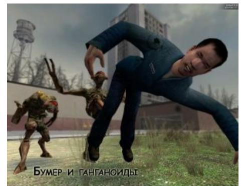
Бумер и ганганоиды

Приходу Воркера на hlfx.ru/forum предшествовала громкая история с расстрелом местного психа и эмо — Alerman -а. Вкратце история такая: эмо-бой Alerman начал изливать на форуме свои ЭМОции про труды Ленина, тяжёлое детство, тиранию админов... Вскоре он заебал всех своим маразмом на half-life.ru и hlfx.ru/forum , и администрация помогла ему покинуть «этот несправедливый форум».