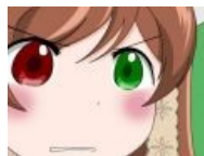
Суисейсеки, desu Лина Инверс