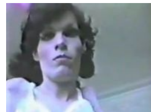
Как на говно

Всё бы ничего, но 29 ноября 2011 на этих ваших ютубах появился видос The Goddess Bunny und Tenderloin — The Golden One . Сам клипеч ничем не примечателен, но теперь Джонни прикован к инвалидной коляске. Печальбеда.