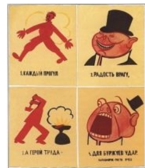
330. Мемский В. Каждый прогугл — радость кругу... 1930