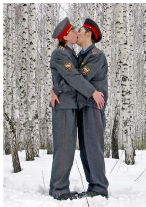
«Typical Russian couple»