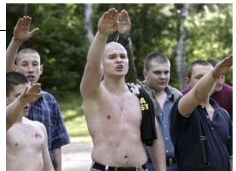
Russian Nazis, lol easy way to troll russians