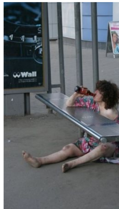
Всемирно известные «Русские Невесты», веселые и предприимчивые