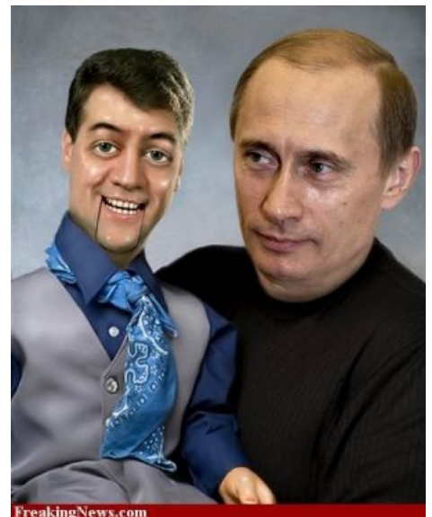
Russia's current president Dmitry Medvedev (your left) with his subordinate Vladimir Putin (your right).

Поддержка Михаила Саакашвили — неплохой способ насладиться драмой на русских форумах. Не забудьте упомянуть, что вы считаете его Гемором и одним из лучших политиков из всех, когда-либо существовавших. Это вызовет такую ярость, что русские будут ломать свои клавиатуры, пытаясь напечатать Вам свой ответ. Когда они начнут говорить, что он — военный преступник, называйте их лицемерами, а военным преступником — Путина. Количество драмы, которое вызовет такая тактика, не поддается никакому описанию, лулзы будут обеспечены очень надолго