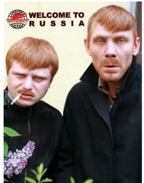
In Soviet Russia, the ginger stab you!