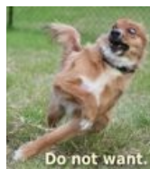
DO NOT WANT