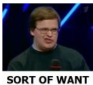
Sort of want