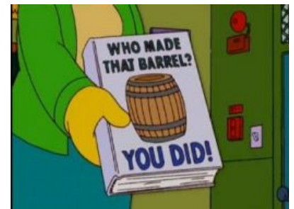
Бочка в Симпсонах