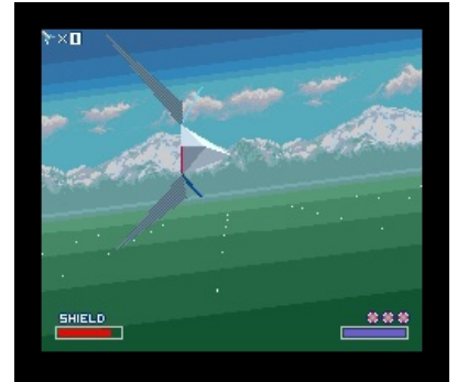
Бочка из оригинального Star Fox'a

Несмотря на расхожее заблуждение, бочка никогда не являлась противоракетным манёвром [1] . Современные ракеты оснащены дистанционными взрывателями и рассчитаны на поражение цели осколками, стержневой и т. п. боевой частью, взрывом «на пролёте», не требующим прямого попадания. Учитывая, что вес БЧ ракет может достигать нескольких десятков килограммов, радиус гарантированного поражения при взрыве варьируется от нескольких до десятков метров. Это полностью исключает голливудские трюки, когда бравые американские лётчики уворачиваются от дооолго-долго (в реальности ракета быстрее самолета в 1,5-2 раза) гонящихся за ними ракет, которые даже умудряются чиркнуть по обшивке самолёта, не взорвавшись при этом, как, например, в фильме «В тылу врага» (хотя потом она таки взрывается и раздраконивает самолет осколками). Also, IRL зафиксированы случаи невзрыва ракет.