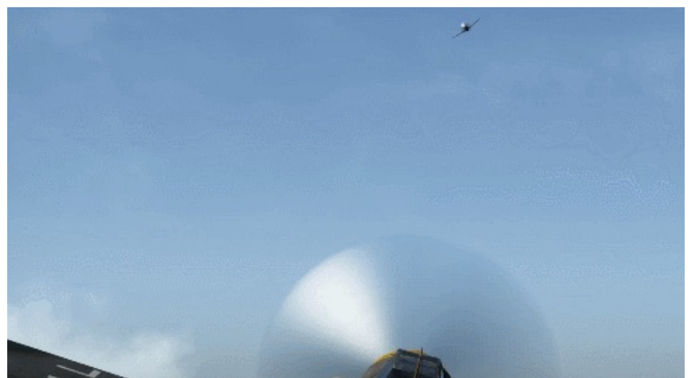
Ган-ката. С бочкой и ракетами