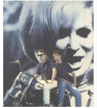
Хороший косплей от Pet Shop Boys