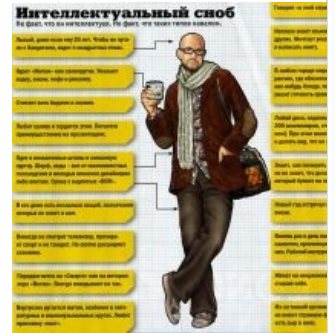
Основная аудитория DM