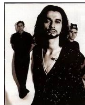
Не менее каноничный образ 90-х