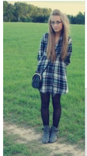
Встречаются и такие экземпляры