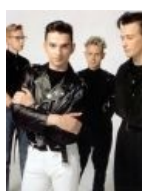
Няшки , погладь их, сука