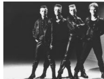
Наш ответ DM