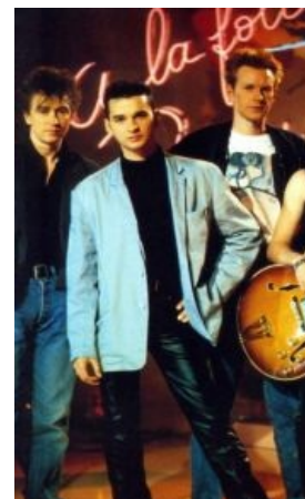
Каноничный образ 80-х