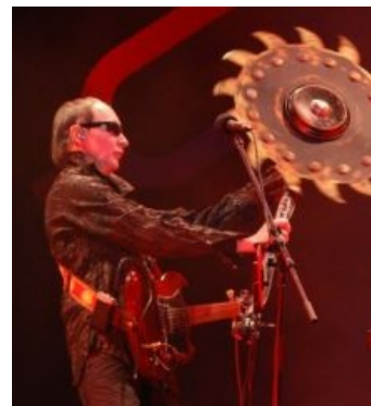
Epic Chainsaw Guy

Что касается «скрябинцев», то изначально они представляли собой украинский ответ DM, который всю стебался над всевозможной попсой. Тексты и тематика песен по степени небыдлизма и сложности вполне могли дать фору DM (тем более, что Мартина Гора не хватало на очень длинные тексты, а тексты «скрябинцев» Роя и Кузьмы иногда являлись полноценными большими стихотворными формами), а музыка являлась достойным примером синтипопа и дарквейва, хотя и записывалась на говёном оборудовании вплоть до 2002 года, как делали в лихие девяностые представители TNBM . После выкидывания на мороз главных фигур, Роя и Шуры, бразды правления берёт на себя Кузьма, с подачи которого группа периодически скатывается то в говнопопс, то в поп-рок, радуя фэндом песнями про олигархов, шлюх и голых девок, хотя релиз «Моя эволюция» 2009 года резко выбивается от генеральной линии банды, возвращая слушателя к поросшим бородой корням. К сожалению, Кузьмы надолго не хватило, и 2 февраля 2015 года он отправляется на охоту за олигархами, с которой так и не вернулся.