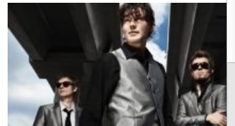
Бравые норвежские хлопцы