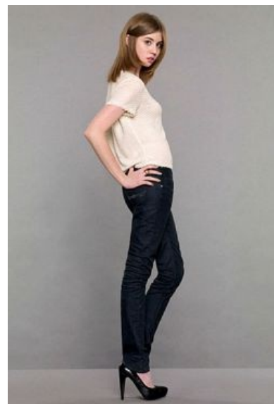
Сложно поверить, что это Крипи-чан