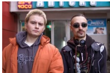
Creator & aalien

Creator — ашпрувер башорга . Со слов самого Крейтора известно, что он хороший и красивый. Также достоверно известно, что телевизором и телефоном Крейттор не пользуется, а питается исключительно интернетом от Корбины. Работает в Яндексе.