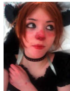
Cracky-chan is so cracky

Cracky-chan (можно перевести как Чих-тян [1] ) — камхора Форчана, одна из первых и самых знаменитых. В 2005 году появлялась на ряде фотографий с чёрными нэко-ушками на голове и странным макияжем. Отличалась от 95% камхор вполне действительно привлекательной внешностью, а также некоторым умением в постановке фотографий. Заставила Анонимуса немедленно испытать чувство высокой, чистой любви . О её популярности в /b/ говорит хотя бы то, что модераторы 4chan в конце концов на слово cracky поставили вордфилтр .