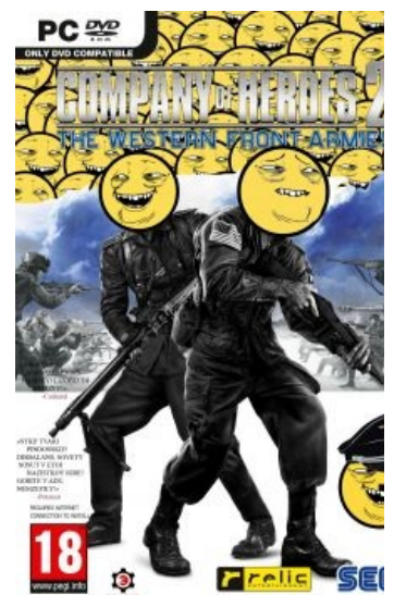
Официальный постер срача дополнения