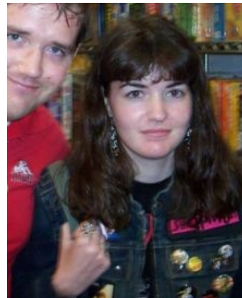
Меган, какие красивые у тебя... усы