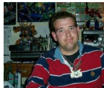
Хочется взять и потискать за щёчки

Также сюда можно добавить интересные факты, картинки и прочие кошерные вещи.