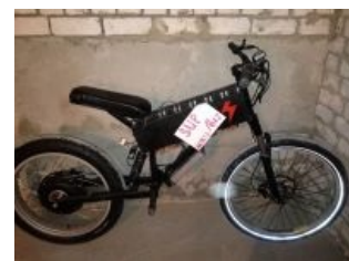
Первое поделие Стелскуна

Был деанонимизирован после статьи на хабре.