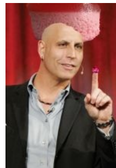
Идейный вдохновитель Agel и желе-куна

Тягучее фруктовое желе говна, вязкая как наша жизнь. Я в недоумении, ОП настоящий шакал, хуже мошенника который понимает что делает нехорошие дела.