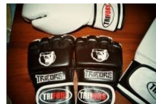
Изделия с говорящим названием от Грушикуна

В ассортимент входят: внезапно — груши; перчатки, чтоб по этим грушам стучать слабыми школьными кулачками; заодно налаживает производство грифов-блинов, чтоб утяжеленные перчатками культияпки можно было поднять. Хоть похвастать доходами на уровне оптовых перекупщиков товаров из Китая он не может, ссылаясь на то, что вся не поддающаяся подсчету прибыль пускается на расширения производства, но мы-то с вами знаем... Как бы там ни было, доставляет своей адекватностью и увлеченностью идеями, алсо, является превозмогшим себя хиккой.