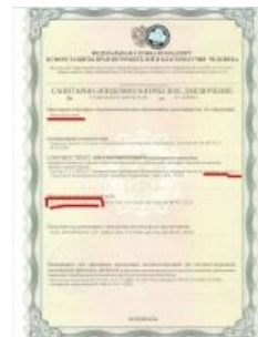
Тот самый «патент на суспензионный гель»

Предлагаемый продукт: суспензионные гели. Если читали статью "Мёртвые доктора не лгут", о которой раньше писал, то это улучшенная форма коллоидных продуктов. Если интересно подробнее - велкам на почту, сейчас создам как раз. Патенты на продукты на 10-15 лет вперед, на технологию тоже. Космонавты на орбите хавают менно суспензионные гели, кстати. Для чисто коммерческого использования патент только у Agel.