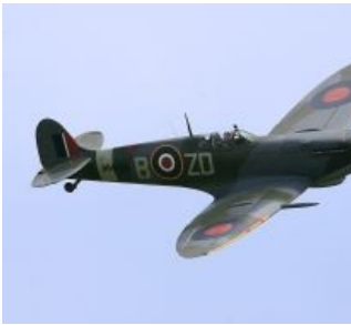
А если так? Supermarine Spitfire, made in UK

Поликарпов И-15. Тоже кукурузер, но повеселее.