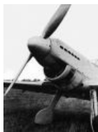
Ранний прототип, Учебный с расово неверным мотором и довольноной лыбой Ju.87