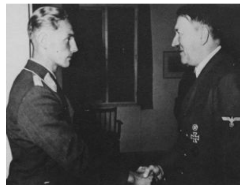
А чего добился ты ?

Тем временем счет сбитых самолетов рос настолько быстро, что даже собственное командование велело перепроверять хартманновские результаты два раза. В итоге сам Дедушка должен был вручать ему Рыцарский Крест, но и тут не обошлось без лулзов, ибо Хартманн прибыл на торжественную церемонию пьяным в говно, как и его попутчики, а уже на месте чуть не спиздил фуражку у Самого, сказав, что просто хотел померить. И, ЧСХ, ничего ему за это не было.