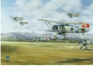
Heinkel He 51. Невеселый кукурузер.