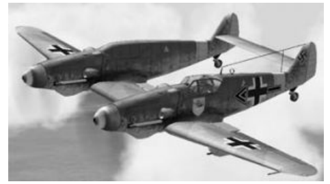
Сдвоенный. Нет, правда

В ответ на жалобные вопли с западной стороны руководство Люфтваффе вспомнило, что недавно им же показывали какие-то новые самолетники... и отправило в Испанию аж два «мессера» и один 112-й «хейнкель». Тут и подтвердилось, что 109-й не просто шустрый, но еще и крепкий: потрошить его тогдашними пулеметами винтовочного калибра надо было долго, а он при этом мог и сам кого-нибудь разобрать. Так Вилли Мессершмитт получил признанный вин — именно его детище было решено сделать основным истребителем Люфтваффе.