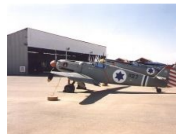
Таки три. Музей IAF, наши дни