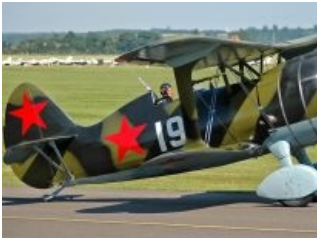
Поликарпов И-15. Тоже кукурузер, но повеселее.