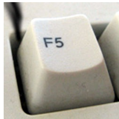
Самая смешная клавиша

Основная побочка — стать УГ ИРЛ . Публику башорга легко узнать по тоске в розовых глазах, либо легкому недоумению в них же в ответ на практически любую шутку. Вследствие давно перевалившего за разумный опыта впитывания сотен юмора в секунду, у среднестатистического посетителя Башорга возникает устойчивая толерантность к юмору. Вызвать слабую улыбку на лице у данного подвида можно разве что клавишей F5. В ответ на все остальное в адрес неосторожного шутника свалится страшное заклинание «ЭТО БОЯН », или «Было год назад на Баше». Часто при рассказах о весело прошедших выходных используются клише из башевских боянов. К примеру «Вчера на хате у одмина бухали, такие корки были ваще, так нажрался аж ваще мегалол».