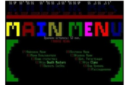
Как оно выглядело

Что характерно, буржуи иногда используют слово BBS в контексте имиджборд , а поднебесцы так именуют форумы, но в наших интернетах слишком хорошо помнят настоящие бибиэски.