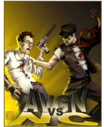
Один из наиболее годных артов