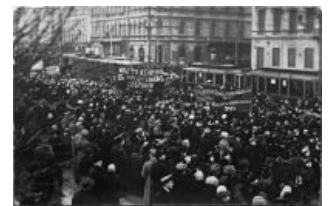
Петроград, 1917 год