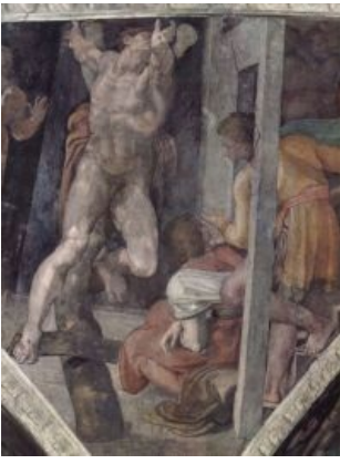
Процесс по версии Микеланджело нашего ди Буонаротти

все должны были кланяться , не поклонился ему по религиозным соображениям, и они нехорошо друг на друга посмотрели. После этого Аман решил, что выпилить одного только Мордехая будет недостаточно, а надо убить всех евреев , на что и получил разрешение царя, компенсируя ему убытки от потери рабов.