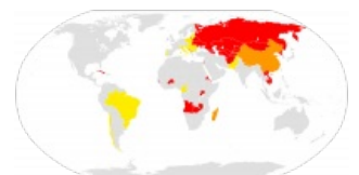
Оранжевый — выходной для тян

Поскольку избирательное право и отмена запрета на