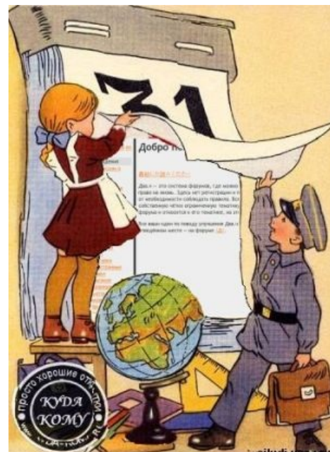
А на самом деле...