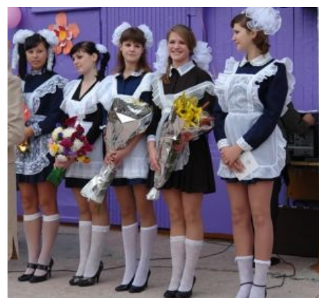
Клюква местного пошива [1]