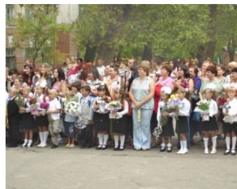
Первое сентября, первый класс

Радостный школяр спешит швырнуть подарить цветы учительнице!