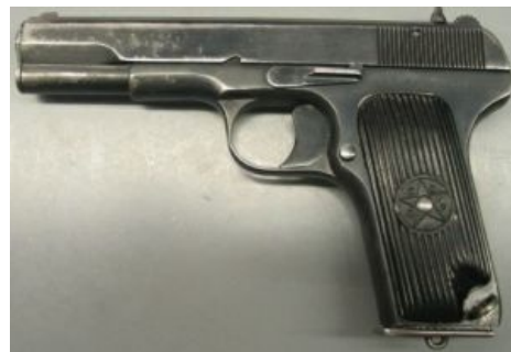
Тот самый пистолет ТТ . В профиль.

Я вас всех ненавижу, я ненавижу Путина, ненавижу Каспарова, ненавижу Макдональдс, ненавижу Дом-2, ненавижу метро, ненавижу российскую провинцию. Я заберу с собой два-три десятка душ. Я пока не решил, в какой ВУЗ города я пойду. Наверное, все-таки, в политех. Я его ненавижу. Хотя одинаково ненавижу и остальные «типа университеты». Я ненавижу людей. Вы у меня попляшете. На раскаленной сковородке