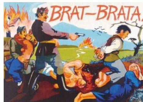
Нацисты как бы намекают: красные партизаны убивают своих, сжигают деревни и ебут друг друга .