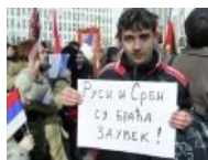
А чем ты помог своим братьям?