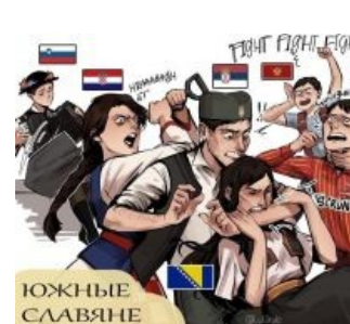
Суть статьи одной картинкой

Получив независимость, хорваты внезапно из мирных социалистических