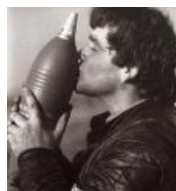
Поцелуи с миной на удачу