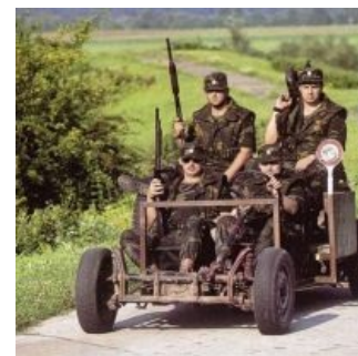
Боевая машина смерти