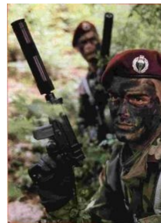
Югославский спецназ в засаде