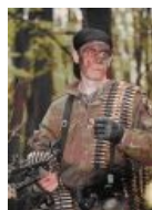
Суров и крут