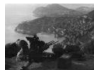
Half-Life 2: Lost Coast