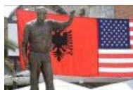
Бушу-младшему благодарные албанцы отлили в граните статую.