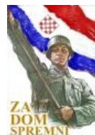
Хорватский ариец: «За дом готов make you unsee it »