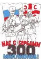
Нас 300 миллионов