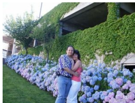
Чтобы свалить в Пиндосию, русские девушки выходят замуж за жирных лысеющих уродов