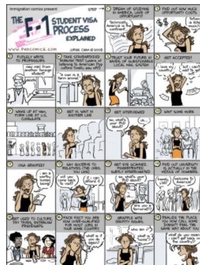
Типичная судьба съедатора в США по учёбе

В англоязычных странах один год может обойтись в 30—50 килобаксов, но есть много стипендий. Формально денег стоит и аспирантура, а стипендия покрывает обучение и жизнь, но зачислять людей, на которых у департамента не хватает финансирования, не принято. В немецкоязычных странах за учёбу денег не берут (или берут ничтожную сумму около €800 в семестр), но и стипендии на жизнь редки (требуется около €8000 в год). Аспиранты же, как и во всей континентальной Европе, считаются