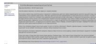
Драма от владельца эльзагейт-канала

Попытки выпилить Эльзагейт-контент с переменным успехом предпринимались почти с момента его появления на ТыТрубке, причем сами по себе они успели породить сотни драмы. Первая волна была поднята пиндосскими яжматерями в феврале 2017 года, правда к успеху она так и не пришла : статьи об Эльзагейте не ушли дальше местных аналогов «Дождя», а массовые жалобы на ролики (в том числе на нарушение копирайта ) Ютуб покрутил на своих правилах сообщества, заявив, что контент, пародирующий в игровой форме известное кино и мульты, не нарушает Правил Сообщества™, а жалобы на него равноценны жалобам игрофагов, понифагов и прочих анимуфагов на ролики, оскорбляющие их объект фапа.