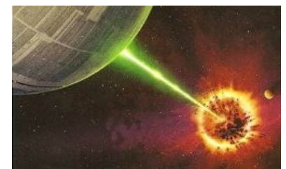
Звезда смерти экстерминирует Альдеран