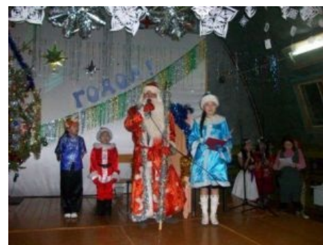
Типичный праздник в школе

Локальный мем, заключающийся в абсолютной, всепоглощающей безблагодатности сих мероприятий. Нет-нет, не 100%, но близко к этому. Как правило, ШП проводятся по любому поводу и без него, включают в себя танец/песню/стихи/спектаклик, выбрать любые три. Нередко школы соревнуются меж собой в том, чьё говно лучшего сорта, аромат нежнее, а консистенция зернистее. Тем не менее, находятся-таки ученики, придумывающие действительно хорошие ШП, и ученики, действительно хорошо их осуществляющие. Закономерно, что при выступлении на каком-нибудь городском конкурсе (а он проводится в ЦДК/доме Пионеров/БКЗ/Дворце Спорта, часто перед ликом ценителейЪ культуры™ и искусства®) побеждает именно та школа, в которой оказались толковые сценаристы и годные актёры. Но то, что творится у большинства — просто феерический адЪ, трэш и колхоз. Особенно больно смотреть на пих-пох-потуги какого-нибудь восьмиклассника или современный мегапупертанец в исполнении тощих, плоских девочек.