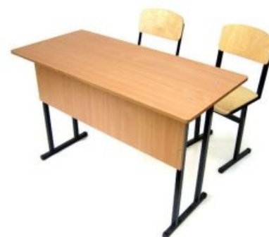
Хорошая, годная парта и её друзья