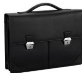
Хороший, годный вариант портфеля

Люто ненавидимый 99% школьников тип издевательства. Введена