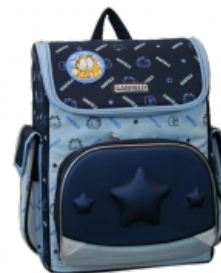
Самый попсовый вид. Вмещает больше, но сосёт в дизайне