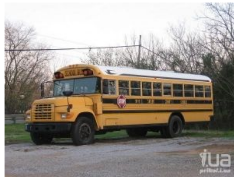
Вот так он выглядит в той стране

Автобус, предназначенный для перевозки школоты. Анонимусу знаком по пиндосским фильмам о школе — Blue Bird Conventional, типичный стереотипный американский автобус. В этой стране занесён в Красную книгу, однако в мегапRESTИЖНЫХ школах (или сельских районах, где дешевле завести один автобус и одного водителя на деревню, чем содержать школу из-за пяти-семи учеников) таки встречается. Как правило, представляет собой КАВЗ-3976 или ПАЗ-3205 разной степени убитости. Редко-редко можно встретить ЛиАЗ-677 , в наши дни их заменили даже в школах, ибо бензин недешёвый, а ездили они на бензине, такие дела. Ещё бывают Икарусы-250 и прочие сараи. Абсолютно все — жёлтого цвета с табличкой «ДЕТИ», что должно предупреждать всех о нехуёвой опасности груза. Автобусы этой страны имеют такие прибабасы, как выдвигаемая ступенька (которая чуть реже, чем всегда засирается грязью и перестаёт быть выдвигаемой), стеллаж для портфелей (о том, что можно просто положить портфель под сиденье, почему-то не догадались). К школьным автобусам существует куча требований (вроде наличия не менее двух взрослых сопровождающих), на которые чаще всего все давно забыли.