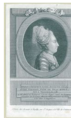
Он же, только в женском платье.