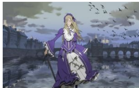
Про него есть китайский порномультик .

Столь колоритный образ не мог остаться незамеченным и нашёл отражение в разных произведениях искусства. Помимо вышеупомянутого романа Пикуля «Пером и шпагой», чья экранизация одно время крутилась по зомбоящику , Еон удостоился также одноимённого сёнен-аниме в свою честь, которое к реальным историческим событиям отношения имеет ещё меньше, ибо фентезя . Несмотря на любовь японцев к всякого рода извращениям , в анимешке всё чинно-мирно и даже без прона, что, конечно, не мешает целевой аудитории писать по ней фанфики .