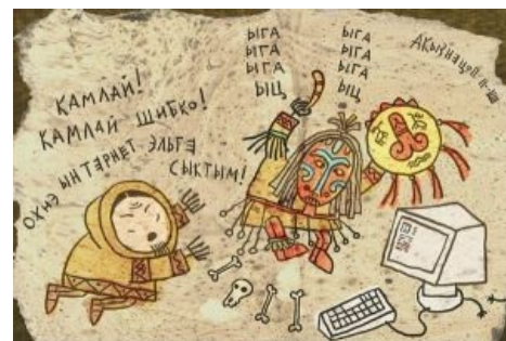
Камлай! Камлай шибко!

Алсо по непроверенным данным, Microsoft на ДСА'08 раздавала бубны в качестве подарков, но в результате демонстрации бубна представителем Microsoft, на поляне упал GPRS и не удалось поднять флаг слёта.