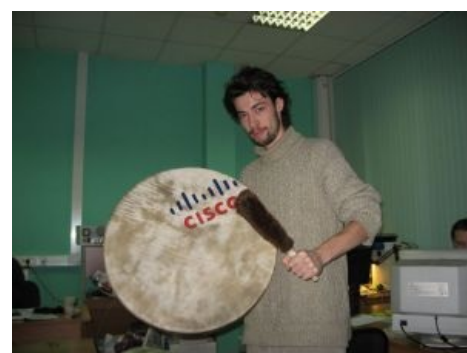
Бубен в действии