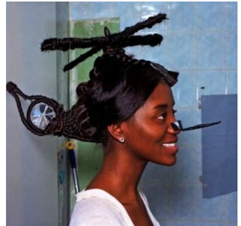
Расово чёрный вертолёт.