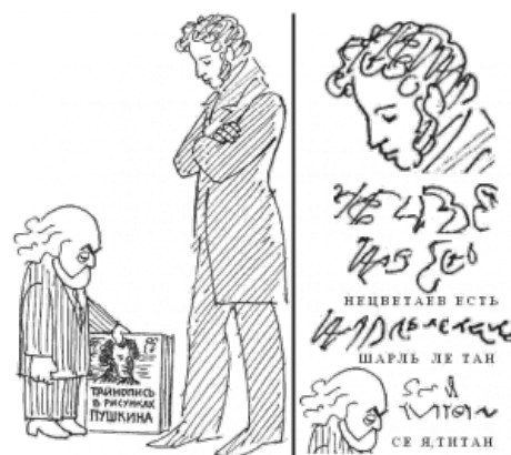
«Расшифровка» Чудиновым карикатуры Л. Нецветова

«И, наконец, самое смешное: Нецветов накрутил на голове Пушкина столько завитушек, что из них вполне можно составить фразу НЕЦВЕТАЕВ ЕСТЬ ШАРЛЬ ЛЕ ТАН (то есть, ШАРЛАТАН), тогда как из знаков моей головы - фразу СЕ Я, ТИТАН . Так что кто над кем смеётся?»