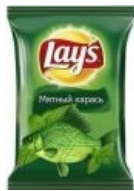
Рыба моей мечты