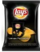
Чипсы со вкусом... рекуссии