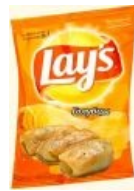
Почти что от Ивана Семеныча