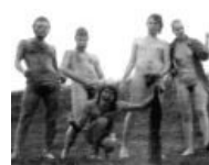
Конец 70-х. Срыв всех покровов (Цой на снимке сидит)