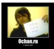
Цой жив и сидит на Нульчане