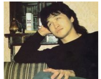
Цой такой Тсой

Цой, Виктор Робертович ( кор. , кит. Цхуй, каш. Тсой; звезда по имени Цой, Цоктор Вий) — известный корейско- ингерманландский расовый акын, певец в ведро, кочегар и на электрогитаре игрец. Идол очень многих русских рокеров. Дохлый герой . Кашениты свято верят в то, что Цой подавился мацой .