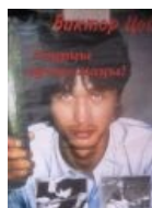
Он гарантирует это