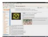
Цой жив на Ментаче