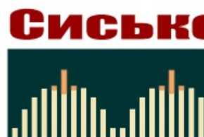
А вот и они.