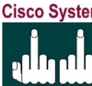
Логотип как бы намекает: нищевродам нет пути.