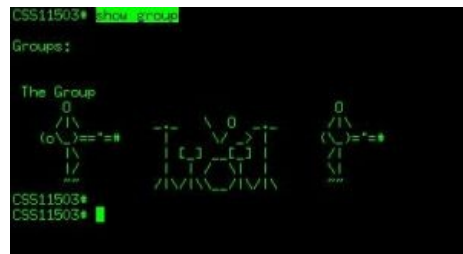
Циска уважает Пасху