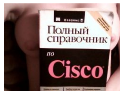
Анечка-тян уважает Cisco

https://www.youtube.com/watch?v=ISzj1PkpUY