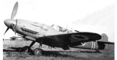
Ой вей! (Чешский S-199, читай — Messerschmitt Bf.109)

Сам же ЦАХАЛ в те времена представлял собой весьма эпичный пиздец. Начинался этот пиздец даже с вооружения — после Второй мировой евреям сбагрили кучу разноразного ненужного в Европе дерьма, так что удивиться тому, что Изья вылезал из «Мессершмитта» с Luger P08 за поясом, а Мойша рулил раздолбанным «Шерманом», было нельзя. Немалая часть добра была привезена банальной контрабандой, ибо с 1947 года пиндосы перекрыли поставки вооружения банхаммером, а Бриташка же кормила оружием арабов. Главным пособником контрабанды, внезапно, был сам дядюшка Джо , жидов тогда любивший в надежде на социализм в отдельно взятом Израиле. Некоторые ништяки, как, например, мететичный миномет «Давидка», крафтились самостоятельно из подручного хлама. Тем не менее среди расовых жидов со всего мира, уже успевших повоевать, идея приезда в Землю обетованную была весьма популярна, так что обстрелянных бойцов в ЦАХАЛе прибывало — четверть состава ВВС, например, составляли бывшие военные из Пиндостана и Британии, так что английский тогда в авиации употреблялся ничуть не реже, чем иврит. ВНЕЗАПНО отличились и финские (!) евреи, которые, де-факто успев побыть гражданами страны, воевавшей на стороне Рейха, активно отправлялись воевать за Израилевку. Впрочем, еще до независимости Израилевки в рядах пейсатых воинов оказался даже без трех минут кавалер Железного Креста , что доставляет взаимоисключающими параграфами еще больше.