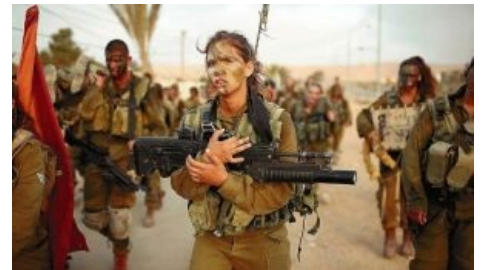
Равноправие в действии

Итак, в России ты идешь в 17 лет в военкомат, дабы пройти приписную медкомиссию, а в Израилевке это же делают и тян. ЧСХ, среди прочего они проходят и тесты на умственное развитие, от результатов которых сильно зависит место будущей службы. Хотя блондинок по понятным причинам в Израиле и не так уж и много.