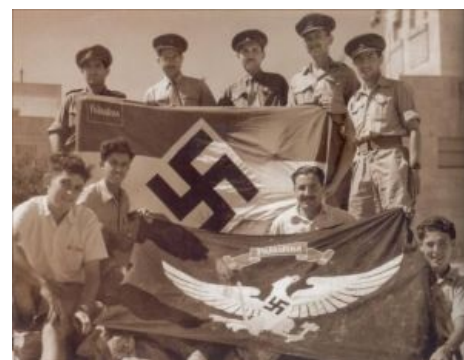
Лехи демонстрирует всю глубину взаимоисключающих параграфов