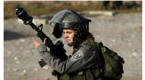
Стелс-пихотинка с пневмопихом

Вообще, как утверждает история, бабы были еще в Хагане и отколовшихся от нее группировках, а некоторые успели даже повступать во времена дедушки в британскую армию (да, в Израилевке оно все сложно закручено). Так что практически сразу с образованием ЦАХАЛа в нем появились и женщины, причем хотя и был создан отдельный Женский корпус под командованием Шошаны Гершон, традиционно понаехавшей отсюда , фактически бабё равномерно размазали по многим частям.