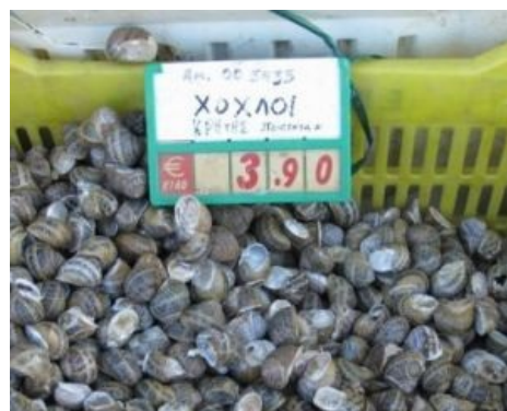
Хохлы в ассортименте

| Если хрен коротковат, это Путин виноват