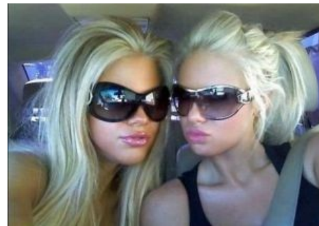
При помещении пересичных украинок (см. выше) в Дефолт-Сити они превращаются в перекисичных хохлюшек

Также в словаре В. И. Даля есть пословица: «Хохол глупее вороны, а хитрее чёрта».