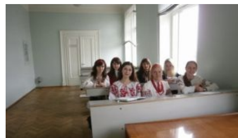
Хохло-студентки по ФОСТу стереотипах