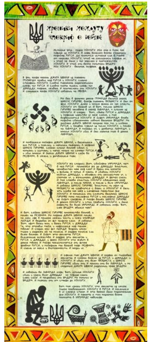
Адаптированная историческая справка