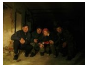
Гопники в подвале

Выпил завершился 21 ноября 2018 года, после чего на месте неудавшейся больницы построят четыре жилых дома. На болоте, блджд! Ждём Ховринку-2?