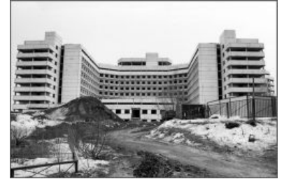
Ховринская заброшенная больница.

Ховринка ( Ховринский недострой , Ховринская заброшенная больница , Амбрелла , ХЗБ ) — бывший полуразваленный бомжатник, огороженный ровно таким же поломанным забором с ёбаной колючей проволокой и, для надежности, охраняемый ЧОПом. Является предметом для фапа херок , готов , свалкеров и прочих любителей поискать приключений на свою задницу и «исследовать» заброшенные места Москвы. Среди прочих заброшек выделяется, во-первых, размерами — больничка поистине огромна, во-вторых, распушенными про неё городскими легендами , с участием секты сатанистов, неизвестных вирусов и мёртвых бабушек и в-третьих, невероятным количеством мусора, обрыганов всех мастей и просто запредельным числом собачьих фекальных масс. Имеет прозвища « Амбрелла » (за своеобразную форму) и «Нимостор» (название, якобы обитавшего в ней кровавого культа поклонников Аццкого Сотоны).