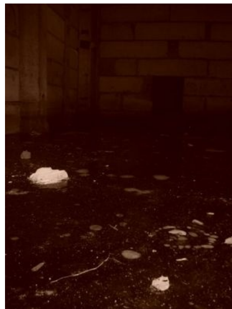
Предполагаемое место купания сатанистов