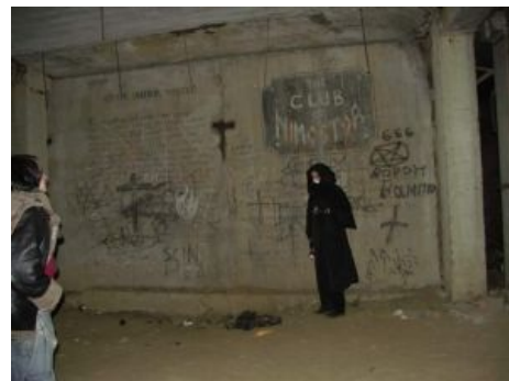
Самцы херки в ХЗБ. Многабукаф на стене доказывают, что надмозги бывают и сцотонистами .