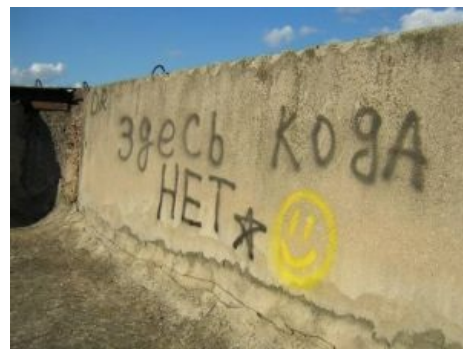
Кода таки нет

Поведение бомжей в рамках недостроя — в большинстве случаев