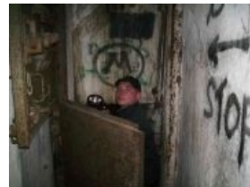
Надпись справа на стене предупреждает