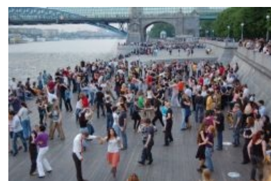
Open air как он есть.

Детский утренник для взрослых. Характерны отсутствием гопников, эмо , говнарей и прочей пиздобратии. Проходит, как правило, в зале с паркетом или ламинатом на полу, с простенькой цветомузыкой и подходящей для данного помещения акустикой . По стенам зала расставлены стулья или лавки, на которых народ отдыхает от трудов праведных . Может работать небольшой бар или стоять автоматы по продаже всякой нямки . На некоторых дискотеках работает камера хранения, куда пришедшие могут сдать свой айфон . В зале звучит музло, партнеры приглашают партнерш (и наоборот) подрыгаться. Бывает, что на дискотеке отмечают чей-то день рождения, и тогда на столах (если они есть), появляется простава, и любой анон может нахалюву глотнуть шампанского, пожрать бананов и конфет. Часто остается неизвестно, кто проставляется, но народ не переживает по этому поводу .