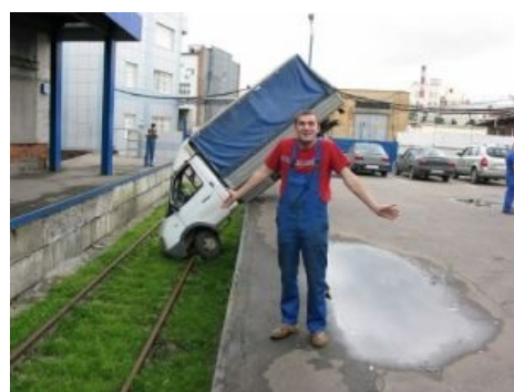
XЗ, как оно так случилось.