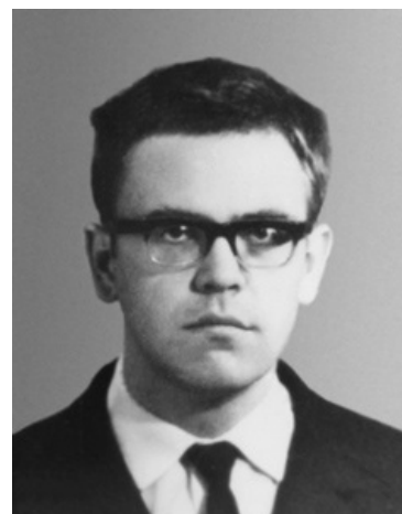
Фоменко смотрит на тебя, как на лживую хронологию

По мотивам изысканий г-на Фоменко и примкнувшего к нему г-на Носовского некоей кинокомпанией Godland Pictures был снят эпический 12-серийный шедевр «История: наука или вымысел?». С первой и по последнюю серию можно наблюдать плавную, но неумолимую деградацию исторической мысли двух великих хроников. В серии номер один описываются действительно научные методы определения дат, в середине сериала приводятся любопытные и вполне правдоподобные исследования отдельных исторических явлений: египетские пирамиды строились на ЕБК (египетских бетонных комбинатах, а не то, что вы подумали), Ярославль — это Новгород, Куликовская битва проходила в центре Москвы, строительство Кремля побашенно описано в Библии... Градус критики хронологов неуклонно повышается и уже в 12-й серии зашкаливает за привычный всем сороковник анисовой. Тут-то мы и узнаём всю правду-матку про родину слонов : история начинается с X века, когда из славянской обезьяны вывелся первый русский, мать Христа была русской (а не тойсамойнациональности, про отца-юриста не упоминалось), японские самураи произошли из Самары, американские индейцы тоже русские, Чингисхан и Батый — русские цари с вполне даже русскими именами, Европа — колония России и другая поебень исключительно в том же самом духе.