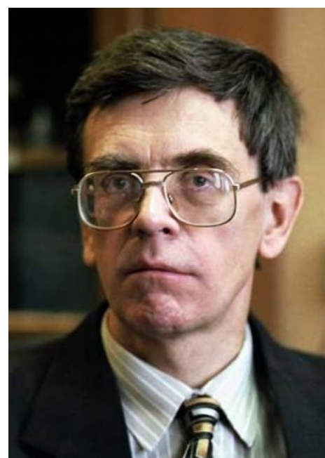
Фоменко видит дальше и глубже тебя

Фоменко, будучи конкретно великим математиком, естественно, начал с того, что всё пересчитал на собственной логарифмической линейке (дело-то начиналось при Брежнев е). И, таки да, если верить истории, то получалось, что некая постоянная « D » вела себя ну совсем не как постоянная. Из чего следовал расово верный вывод: истории верить не надо! На самом же деле , вывод тут совершенно обратный: не надо верить Фоменко! Ибо никаких пруфлинков с результатами пересчёта никто никогда не видел, а великий