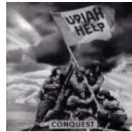
Англичанка гадит, дубль 2