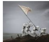
Имперские штурмовики берут очередной рубеж