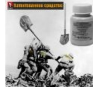
Черенок от лопаты и МД