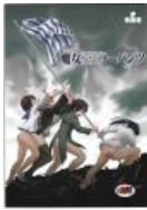
Панцу на Иводзиме