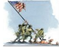
Водворение демократии на Ближнем Востоке