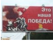
Это наша победа! Геофронт взят!