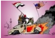
Тем временем в Ираке...