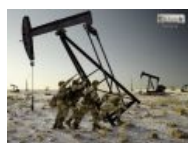
В наше время