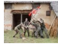
Немецко-фашистская «иводзима» в русской деревне. Да еще и с перевернутым флагом