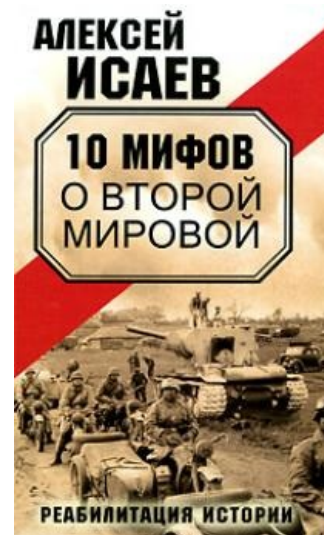
Типичный пример. Вся Правда о.

В этой стране борьба фальсификации истории с борьбой с фальсификацией истории является отражением борьбы старых и обрусевших агентов влияния