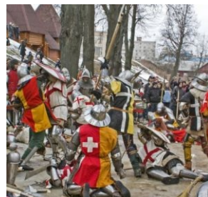
Бугуртсмены, тысячи их!