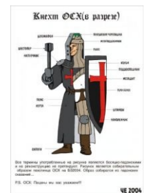
Кнехт в разрезе.

Одним из первых великих холиваров, о котором помнят лишь люди, пришедшие в конце 90-х (то бишь уже не помнит никто, потому что часть уже