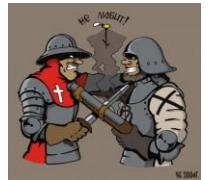
Реконский холивар. В реале у них всё происходит так же.