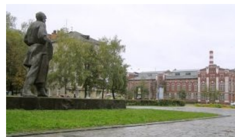
Толстой идёт за водкой