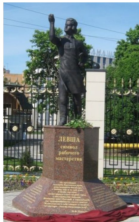
Левша смотрит на блоху с гордостью творца или Памятник маленькой зарплате