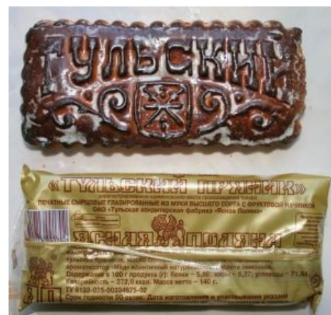
Тульский пряник в Палате Мер и Весов