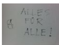
«Всё для всех»