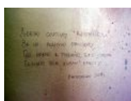
Ода Альма- матери