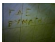
Клиенты недовольны (а-ля Tension )