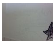
Туалет мюнхенской студенческой организации