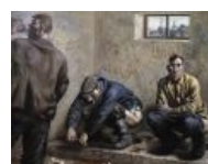
Отражение сабжа в живописи