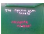
Grammar Nazi зашли посрать кирпичами