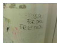
Университет Бонна. «Срите за мир»