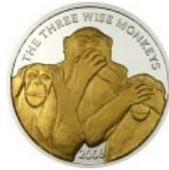
Современная сомалийская монета