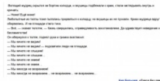
Пасхалка-памфлет для советской школоты сквозь призму Алисы Селезнёвой

В остальном мире мем чаще используется для маркировки людей, отказывающихся принимать происходящие вокруг события или действовать в какой-либо ситуации. Ближайший аналог — позиция страуса: засунуть макушку в песок. Или же для обозначения всеобщего безразличия к чему-то шокирующему и ужасному. Вроде как если не замечать проблемы, то её и нет вовсе.