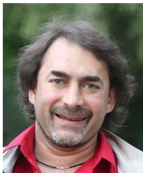
Типичный коуч. По