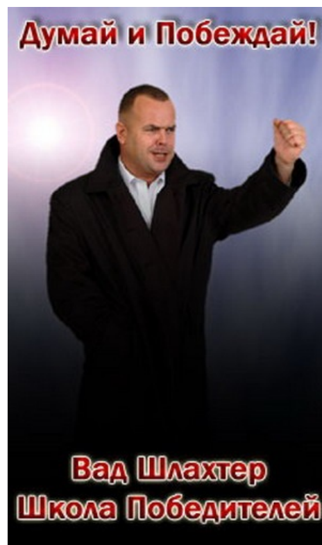
Тренинг «Как поиметь весь мир» как бы намекает